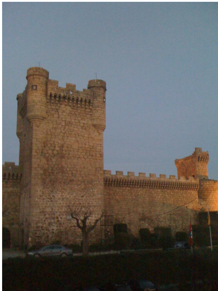
Torre del homenaje del castillo

música actual acompañándose de guitarra y caja de percusión. Gredos estaba oculto tras las nubes que levitaban a baja cota sobre la llanura.