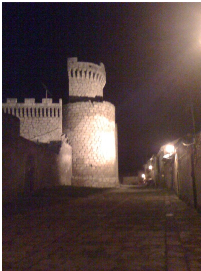
Un torreón en la noche