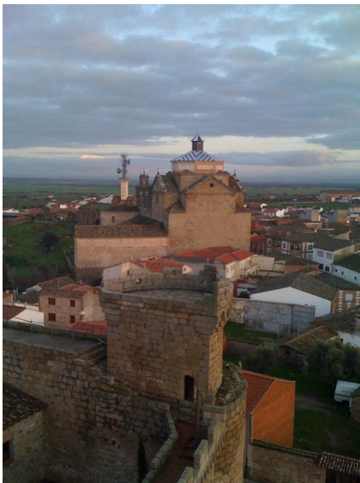
Iglesia de los jesuitas desde la torre del homenaje del castillo

La iglesia de los jesuitas estaba en ruinas hasta hace poco tiempo que la han restaurado. Es un edificio soberbio, alto, con paños de pared hechos con bloques de granito perfectamente tallados. No presenta ventanas ni otro tipo de huecos al exterior y da sensación de robustez. La iglesia tiene base de cruz y en el cruce del asta