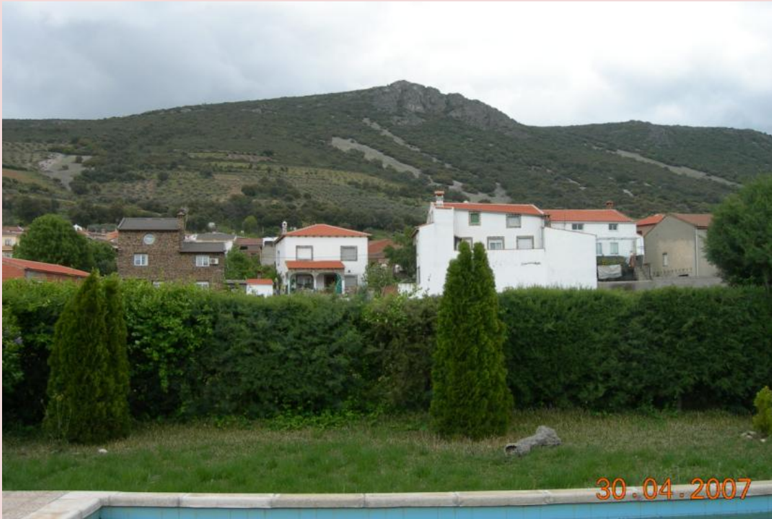
Navatrasierra y en lo alto de la Sierra de Altamira, el Risco Pelao , testigo del acto