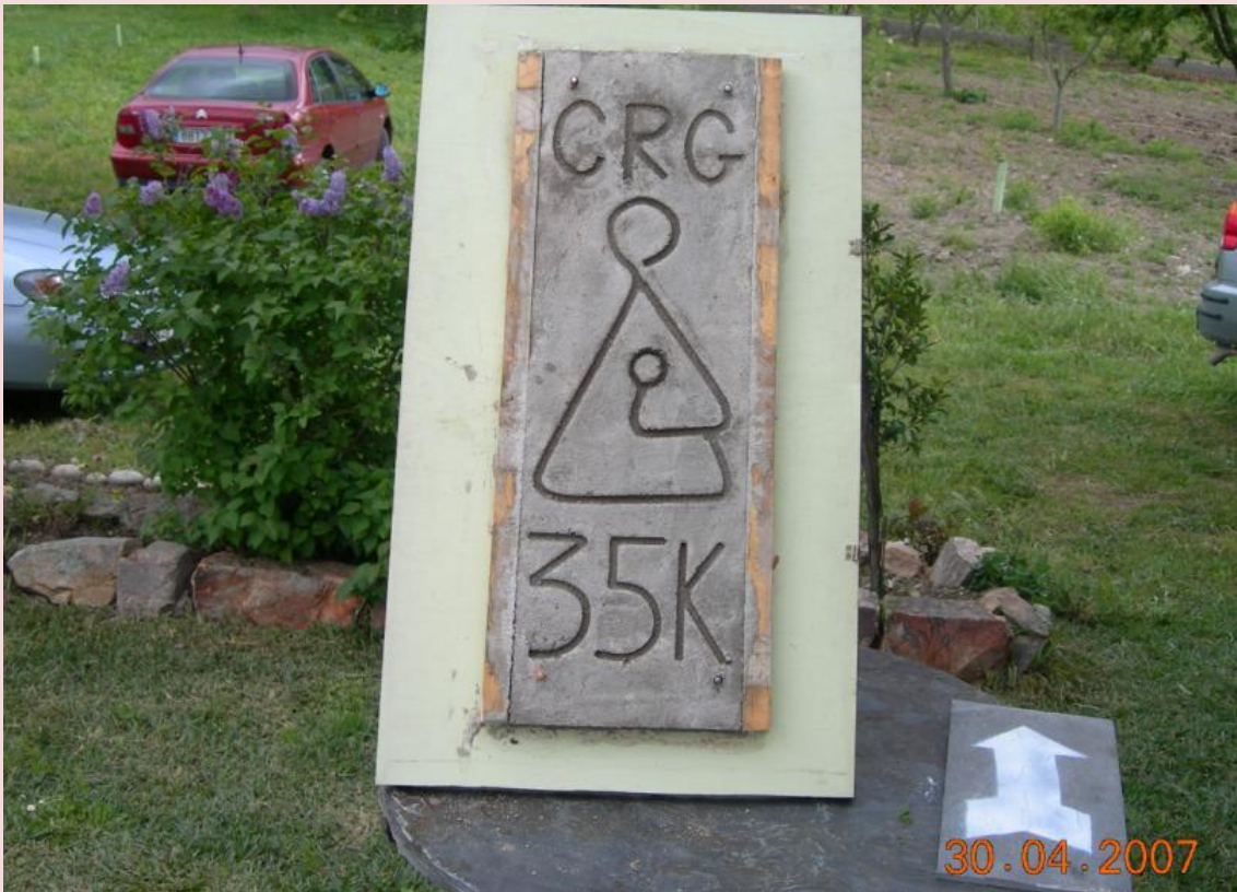
Placa de cemento para celebrar el evento histórico con el boceto del logo que se aprobó ese día para identificar los Caminos Peregrinos a Guadalupe