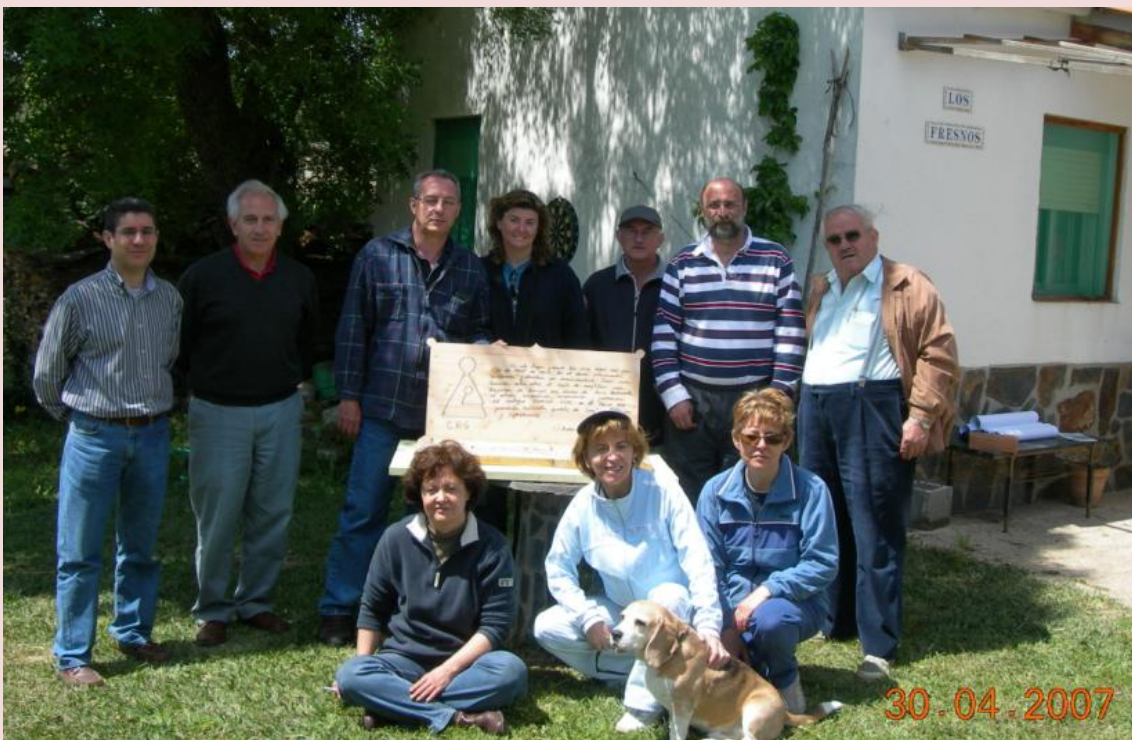
Los artífices tras la comida y la bebida, como demuestran sus sonrisas.