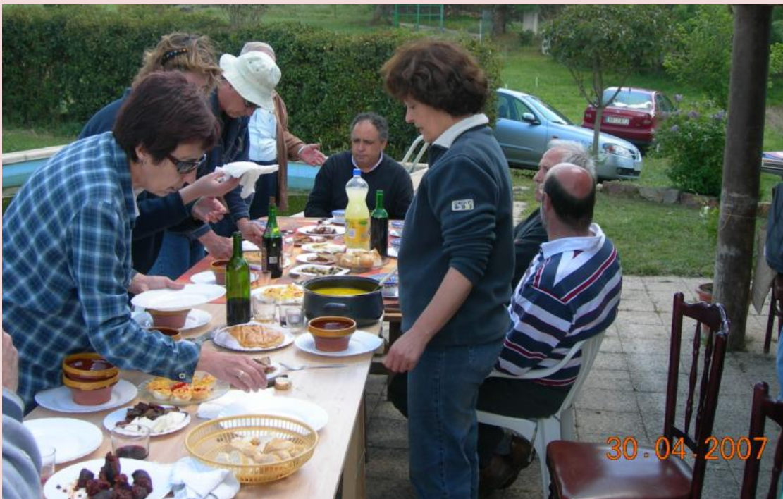
Preparando las viandas las mujeres, pues los hombres....ya se sabe