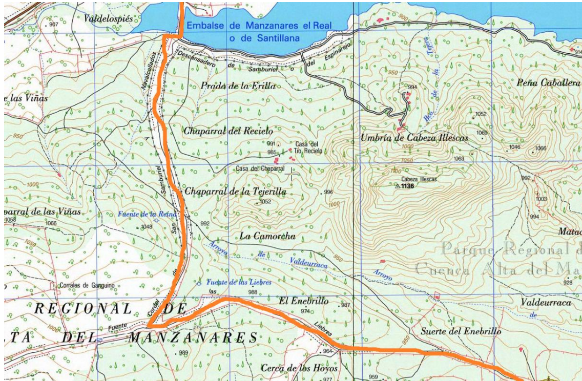
Por el Cordel de Samburiel hasta Manzanares